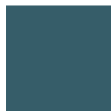
ダークブルー（サブ）

色指定する際には 指定したインク色・かけ合わせを使ってください。 その中での優先色は DIC 213 です。 いずれを使う場合もグリーン（メイン）に最大限に近づけてください。