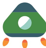
シンボル・マーク（フルカラー版）

シンボル・マーク（フルカラー版）には複数のカラーが使用されています。 シンボル・マークの再現にあたっては、指定色の設定を確認し、色校正を行ってください。